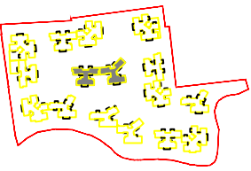
总平面位置示意图