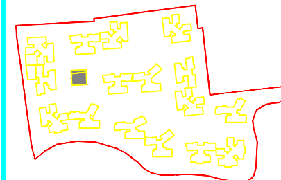
总平面位置示意图