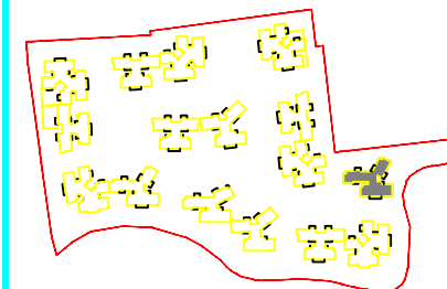
总平面位置示意图