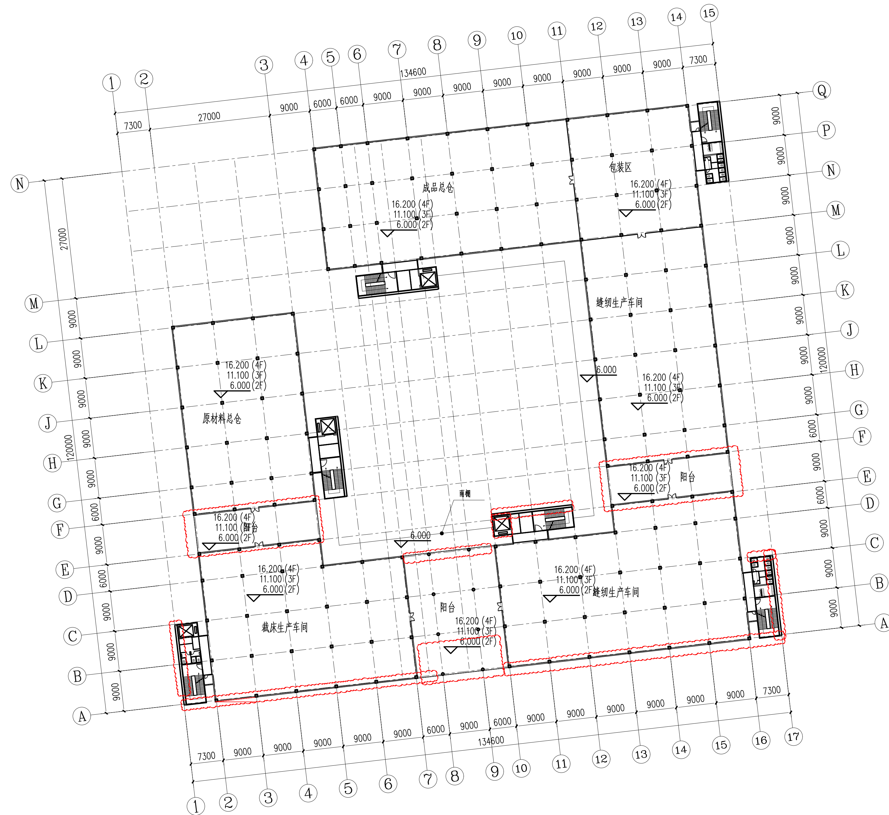
北区厂房及仓库二、三、四层平面图 1:1000