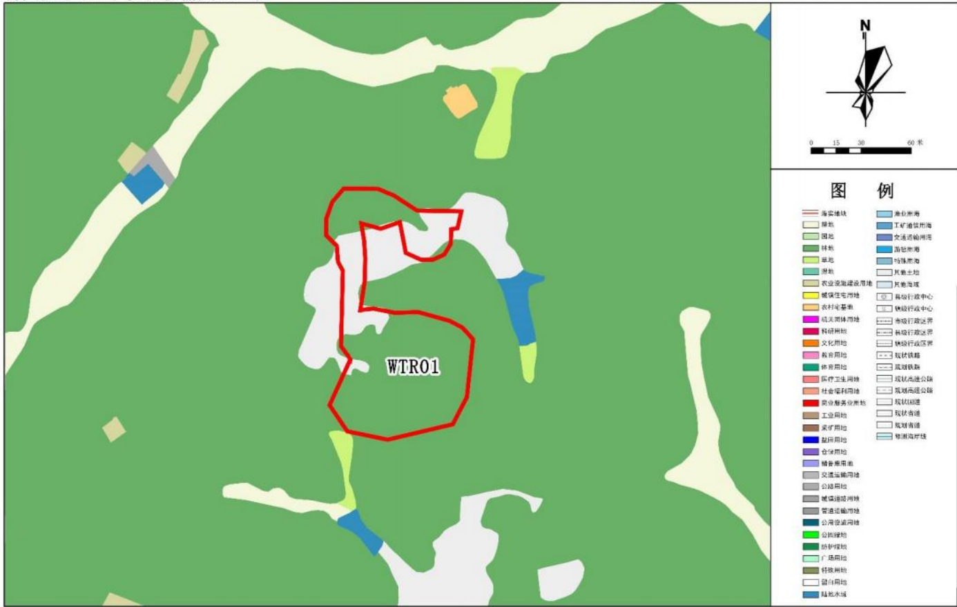
兴宁市大坪镇落实前地块土地使用规划局部图（WTR01）